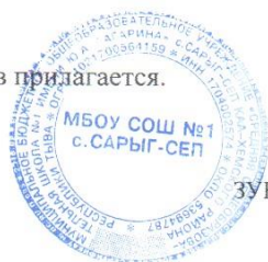
Таблица результатов прилагается.